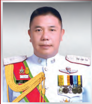
พล.ต.ท. รณเชิลป์ ภู่อาระ ผบช.ภ.๕