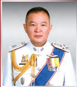
พล.ต.อ. ศักดา เตชะเกรียงไกร ที่ปรึกษาพิเศษ ตร.