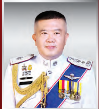
พล.ต.ท. พูลทรัพย์ ประเสริฐศักดิ์ ผบช.ภ.๕