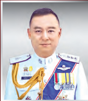
พล.ต.ท. กิตติพงษ์ เงามุข ผบช.ภ.๗