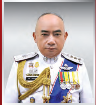
พล.ต.ท. จิตติ รอดบางยาง ผบช.ภ.๒