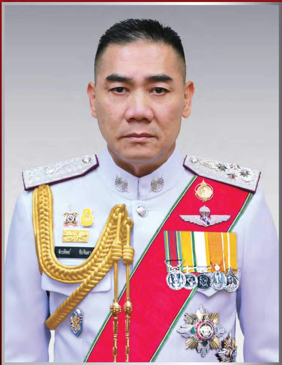
พล.ต.อ. จักรทิพย์ ชัยจินดา ผบ.ตร.