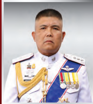
พล.ต.ท. สุทธิพงษ์ วงษ์ปิ่น ผบช.สตม.