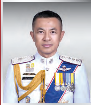
พล.ต.ท. สุวิวัฒน์ แจ่มยอดสุข ผบช.ภ.๑