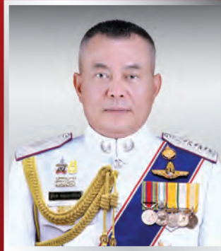
พล.ต.ท. สฐิติราช หนองหารพิทักษ์ ผบช.ก.