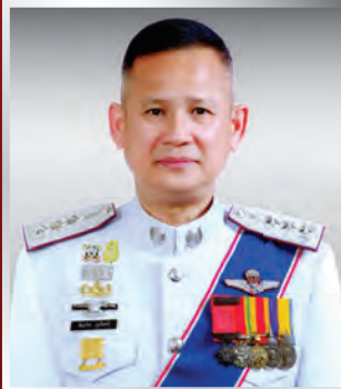
พล.ต.ท. ศิณภัทร ภูมรินทร์ แม่ช.สกบ.