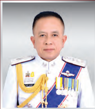
พล.ต.ท. ทวีชาติ พละศักดิ์ ผบช.ภ.๖