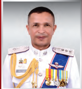
พล.ต.ท. สาคร ทองมุณี แม่ช.ทท.