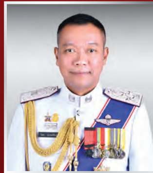
พล.ต.อ. วิทยา ประยงค์พันธุ์ ที่ปรึกษาพิเศษ ตร.