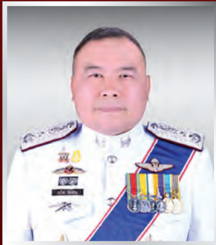
พล.ต.ท. สารีข นิมเจริญ ผบช.ส๓๓.