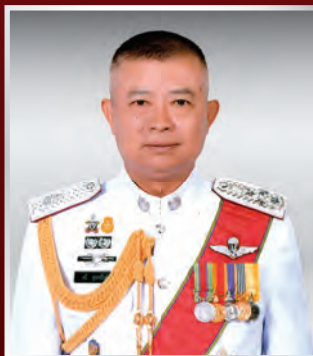
พล.ต.อ. กวี สุกานันท์ ที่ปรึกษา (สบ ๑๐)