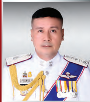
พล.ต.ท. นเรศ นันทโชติ รอง จตช.