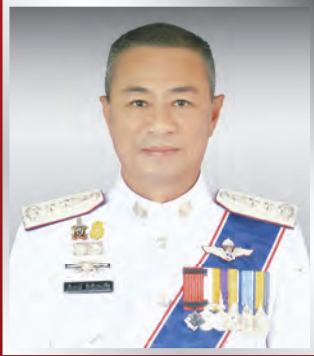
พล.ต.ท. เต็มพวงษ์ สิทธิประเสริฐ จตร.(สบ ๗)(หน.๑๓.)