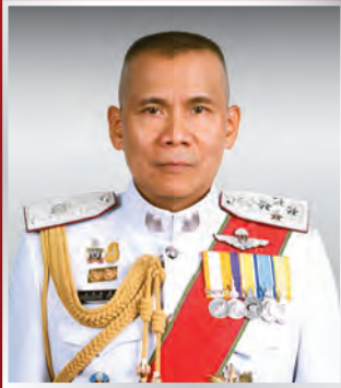
พล.ต.อ. เฉลิมเกียรติ ศรีวรขาน รอง ผบ.ตร.