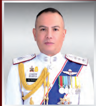
พล.ต.ท. รอย ธิงคไพโรจน์ ผบช.ศ.