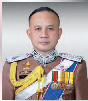
พล.ต.ท. ปิยะ อุทาโย แม่ช.ร.ร.นรต.