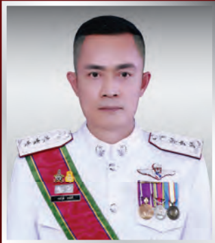
พล.ต.ท. พงษ์วุฒิ พงษ์ศรี ผบช.สพฐ.ตร.