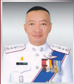
พล.ต.ท. เพิ่มพูน ชิดชอบ จตร.(สบ ๗)