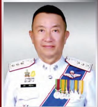
พล.ต.ท. ธนัท วงศ์สุวรรณ แม่ช.สกพ.