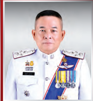
พล.ต.อ. รุ่งฤทธิ ชุ่มทรัพย์ ที่ปรึกษาพิเศษ ตร.