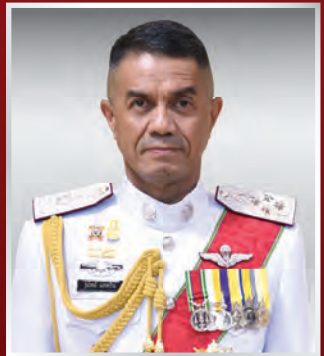
พล.ต.อ. รุ่งโรจน์ แสงคร้าม รอง ผบ.ตร.